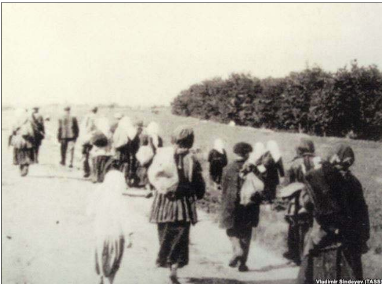
Голодні селяни залишають села в пошуках їжі (1933 р.).

– Паспортна система і супутня їй прописка були призначені насамперед для посилення контролю за населенням і припинення міграції сільського населення в міста. Однак у той час сільським жителям паспорти не видавалися. Наповнення під час Голодомору українських міст голодуючими селянами, які туди проривалися, натовпами жебраків жінок з дітьми дало привід владі вжити заходів для запобігання безконтрольному переміщенню населення. Відтепер селяни на кілька десятиліть були замкнені, подібно кріпаком, у своїх колгоспах і радгоспах. Сама влада відверто пояснювала запровадження паспортів потребою боротьби з «антигромадськими елементами» – з «куркулями», які пе-