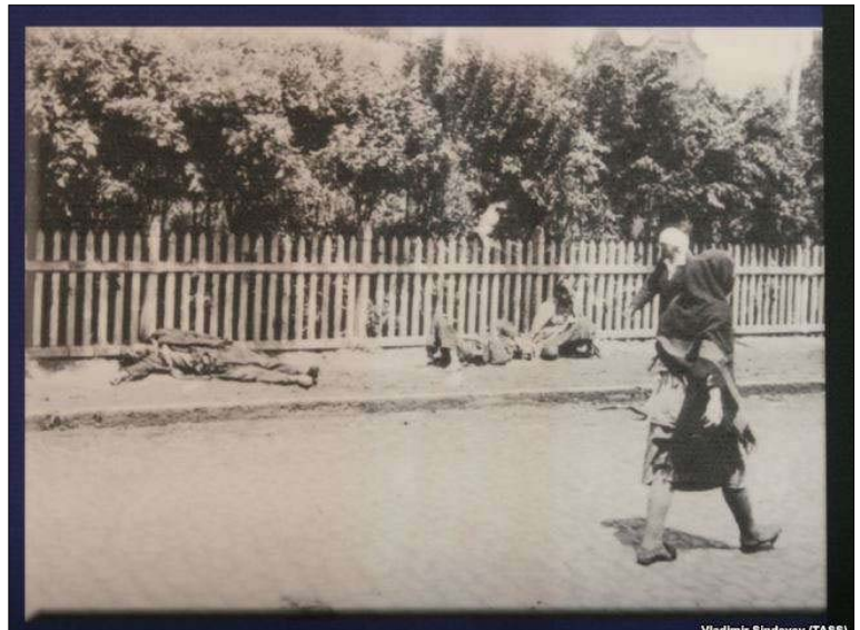
Фрагмент виставки «Голодомор 1932-33-х рр. – геноцид Українського народу»

– Влада були стурбована не тільки запобіганням спроб голодуючих покинути Україну, але й прагнула максимально обмежити доступ туди з інших частин Союзу. Приховування злочину, його замовчування – традиційна політика сталінського режиму. З цією метою заслони з частин ОГПУ й армії були виставлені в усіх можливих пунктах перетину цього «віртуального» кордону. Сотні тисяч людей в той час залишили в Україні свої будинки в спробі перебратися в місця відносного благополуччя. Їх перехоплювали на КПП, заарештовували і виганяли назад. Вокзали, як в Україні, так і в суміжних регіонах, були блокувані частинами ОГПУ. З поїздів знімали не тільки біженців, але й тих, хто намагав-