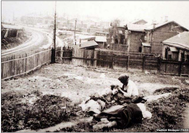
Vladimir Shideyev (TASS)