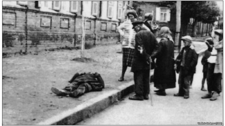
Фрагмент виставки «Голодомор 1932-33-х рр. – геноцид Українського народу»

– Мені здається це коректним. Я керуюся початковим значенням цього терміну, що належить його творцеві – польсько-українському юристу Рафаелю Лемкіну. На мій погляд, його дефініція геноциду повністю відповідає наслідкам Голодомору. Однак використання цього поняття в рамках міжнародного права, заснованого на юридичних установленнях ООН, утруднене, оскільки злочини радянської вла-