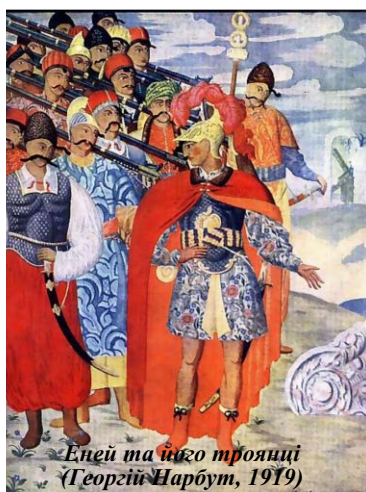
Еней та його троянці (Георгій Нарбут, 1919)