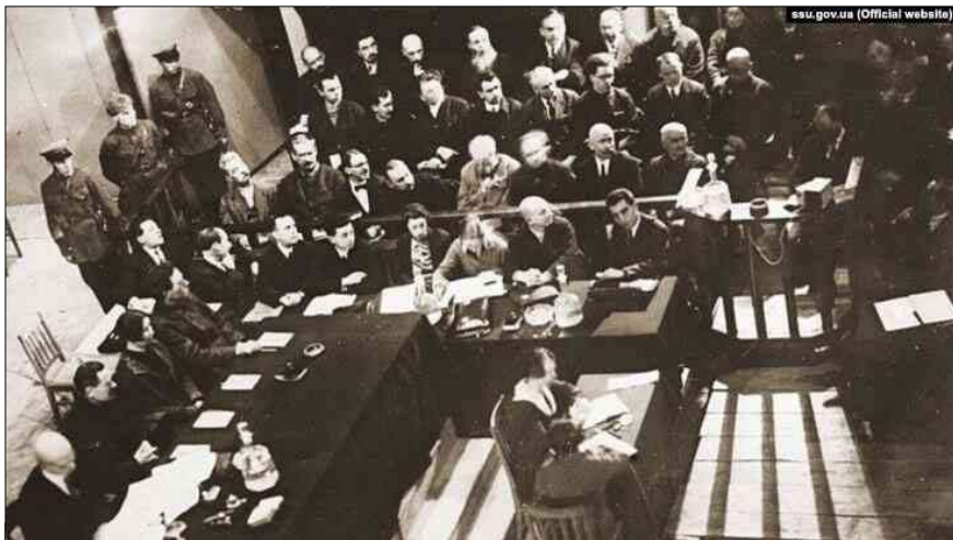
Судовий процес у справі «Спільки визволення України». Харків, 1930 рік