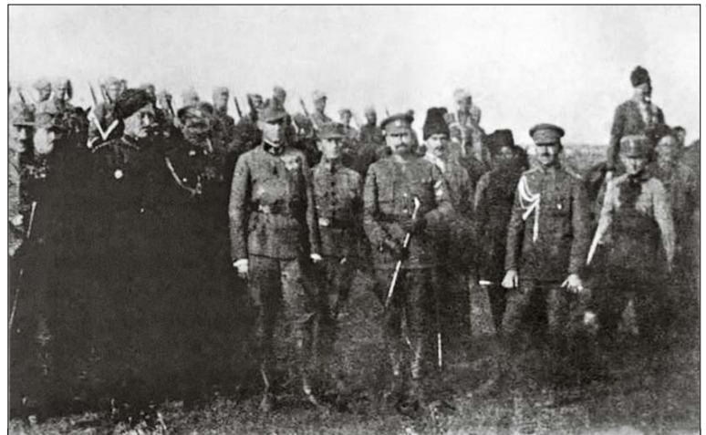
Вояки групи Петра Болбочана і Українські Січові Стрільці, які прийшли в Україну разом з частинами австрійської армії. Ліворуч від полковника Петра Болбочана – командир УСС полковник Вільгельм Габсбург (Василь Вишиваний)

Основним мотивом різко негативного ставлення «збунтованої демократії» до Болбочана був страх за власну долю: міністри-соціалісти бачили в Болбочанові «майбутнього