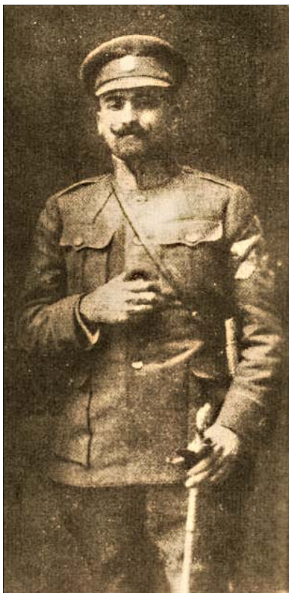
Полковник Петро Болбочан в часи походу на Крим

Болбочан не належав до жодної політичної партії, більше того, за спогадами Б. Монкевича, він постійно підкреслював, що «військо мусить бути аполітичне і що всілякі заходи ввести до війська політику і партійність будуть